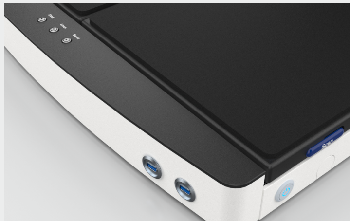
2 USB 3.0 Anschlüsse zum Speichern der Scans auf jedem USB-Stick